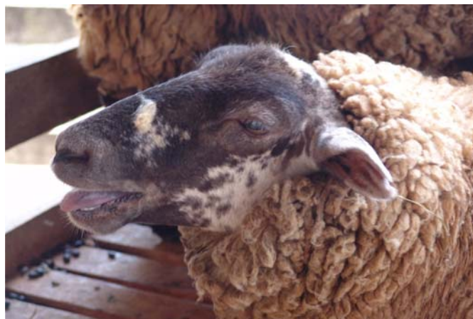
Fig.2. Neurotoxicose causada por Aspergillus clavatus em ovinos (Ovino 3). Animal respira com a boca aberta e expõe a língua.

A imunomarcagem do neurofilamento foi observada