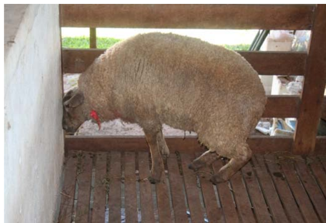
Fig.1. Neurotoxicose causada por Aspergillus clavatus em ovinos (Ovino 2). Animal demonstra fraqueza nos membros pélvicos e deslocamento do apoio para os membros torácicos.

Exceto pelo Ovino 4, nos demais, a frequência respiratória aumentou progressivamente e evoluiu para respiração com narinas dilatadas e, posteriormente, ofegante com a boca aberta e a língua exposta (Fig.2). O apetite permaneceu nesses ovinos até próximo da morte ou eu-